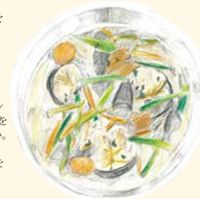
イラスト:鈴木奈々子氏

*冷製としてサービスするのもよい。 *ソースとしてブル・ブランにアンチョヴィーのピュレを加えたものを供するとよい。 *ソースにパセリのほかにセルフィーユ、シブレットを落とすのもよい。